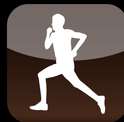
有酸素ランニング