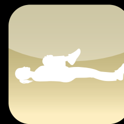
骨盤セルフストレッチ