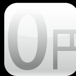
夏のキャンペーン